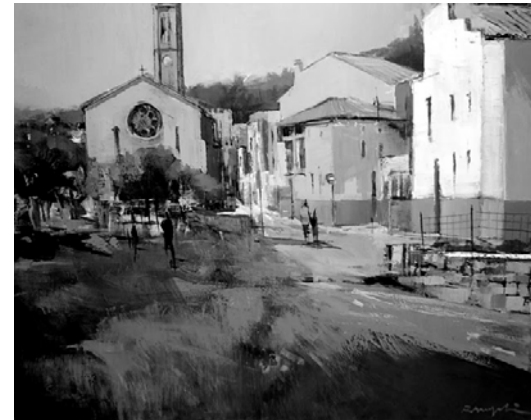
2n Premi 2011