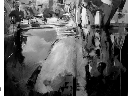
1r Premi 2011